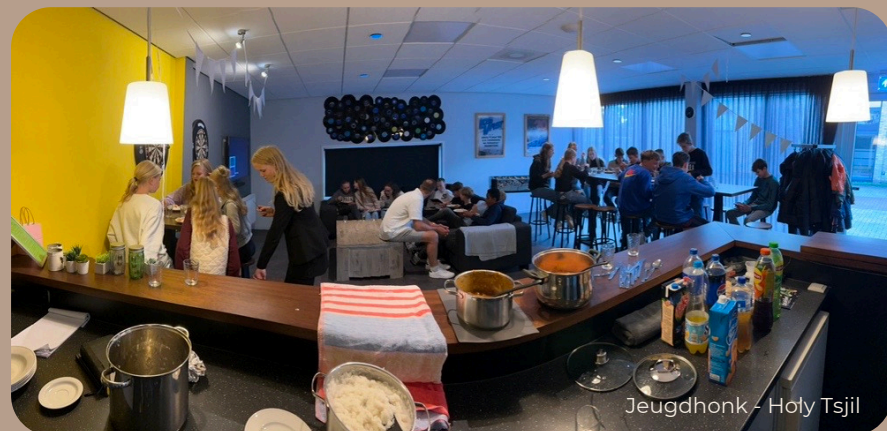
Jeugdhonk - Holy Tsjil